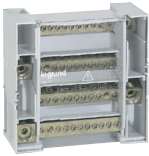
0 048 77